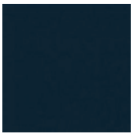
RAL 7016 Gris anthracite