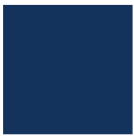
RAL 5003 Bleu Saphir