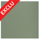
GRIS 2800 Sablé