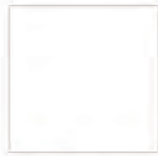
BLANC proche RAL 9016