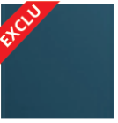
BLEU 2700 Sablé