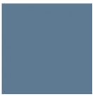
RAL 5014 Bleu Pigeon