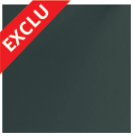
GRIS 2900 Sablé