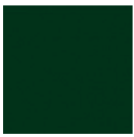
RAL 6005 Vert Mousse