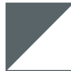
GRIS BASALTE Blanc intérieur et Noir mat extérieur