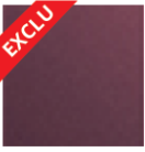
ROUGE 2100 Sablé