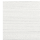
BLANC CÉRUSÉ 2 faces