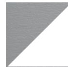
GRIS ARGENT VEINÉ Blanc intérieur et Gris argent veiné extérieur