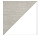
MÉTAL BROSSÉ PLATINE Blanc intérieur et Métal brossé platine extérieur