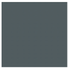
RAL 7012 Gris basalte