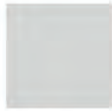
GRIS proche RAL 7047