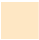
RAL 1015 Ivoire Clair