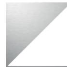
MÉTAL BROSSÉ SILVER Blanc intérieur et Métal brossé silver extérieur