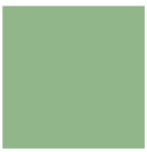
RAL 6021 Vert Pâte