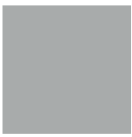
RAL 9006 Gris galet