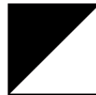
NOIR MAT Blanc intérieur et Noir mat extérieur