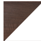
NOYER Blanc intérieur et Noyer extérieur