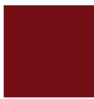
RAL 3004 Rouge pourpre