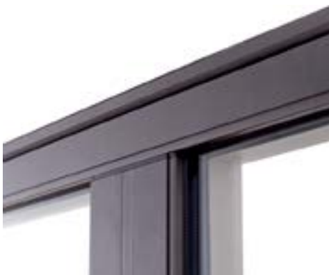
▶ Design droit et moderne (vue extérieure).