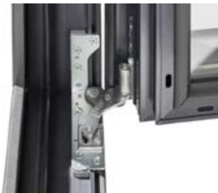
▶ Charnières invisibles disponibles en option afin d'épurer au maximum votre menuiserie.