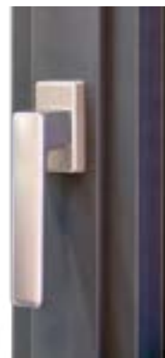
▶ Poignée contemporaine. ▶ Poignée centrée en option.