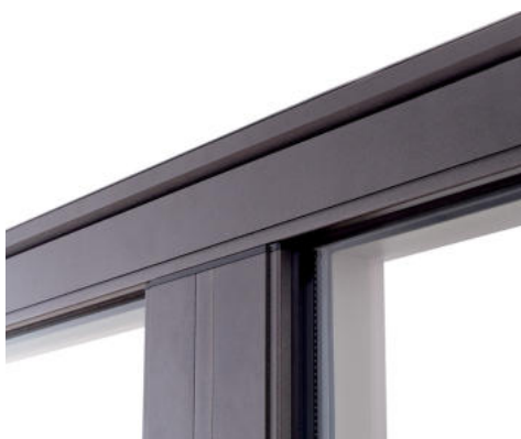
► Design droit et moderne (vue extérieure).