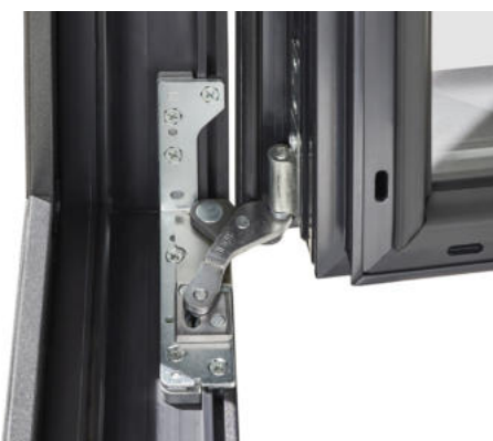
► Charnières invisibles disponibles en option afin d'épurer au maximum votre menuiserie.