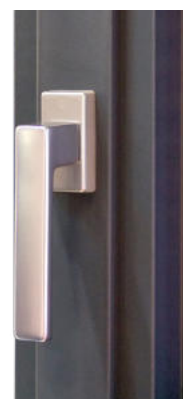
► Poignée contemporaine. ► Poignée centrée en option.